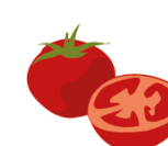
tomate longa vida