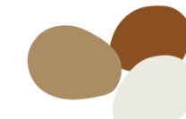
ovos de granja